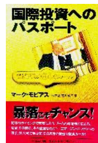
「エマージング・ファンドの旗手」が初めて明かす、その思索と黄金の投資ルール!