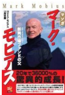
興市場(エマージングマーケット)ファンド投資の第一人者、モビウス博士の伝記コミック